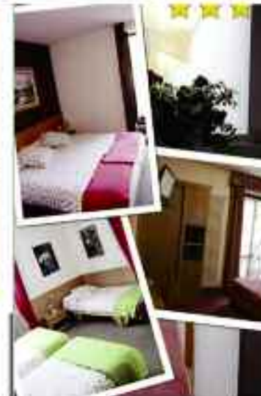
Camere singole, doppie, triple.